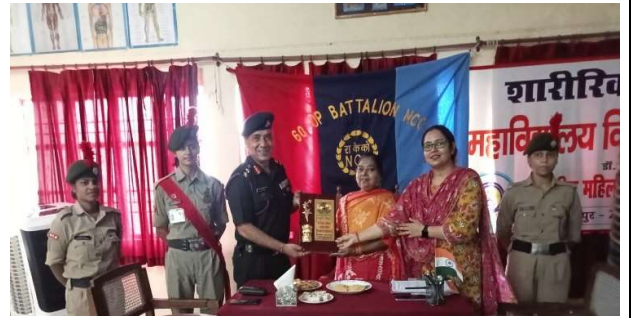
एनसीसी कमांडर द्वारा यूनिट निरीक्षण 2023