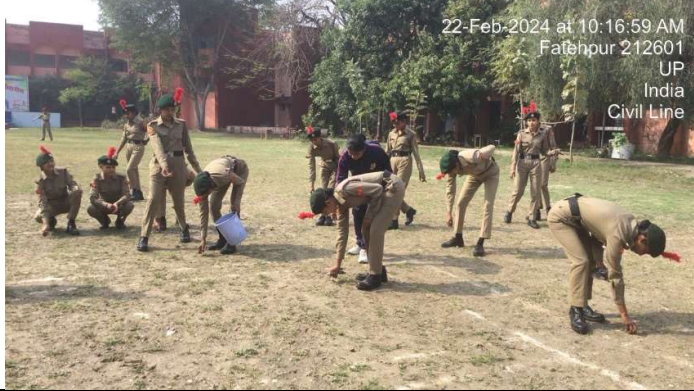
22-Feb-2024 at 10:16:59 AM Fatehpur 212601 UP India Civil Line