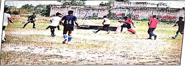
स्पोर्ट स्टेडियम में हाली के ट्रायल में दमखम दिखाते प्रतिभागी।