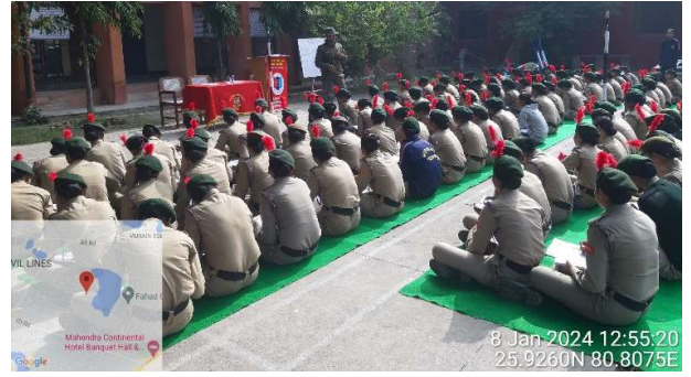
पीआई स्टाफ द्वारा उसे सिक्का छाया लेना।