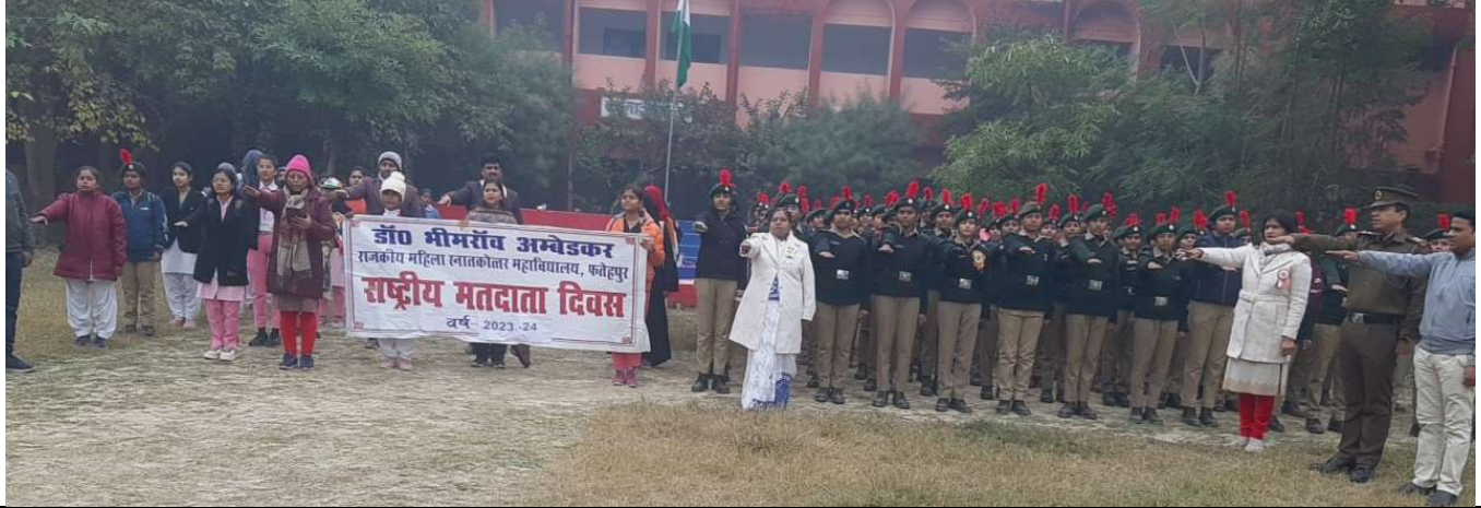
राष्ट्रीय मतदाता दिवस पर। शपथ ग्रहण करना।