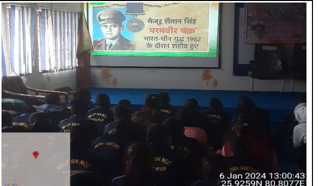
6 Jan 2024 13:00:43 25.9259N 80.8077E