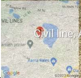
02-Oct-2023 8:31:20 am 25°92'58.162"N 80°20'38.953"E Civil line, AK Rd, Civil Lines, Fatehpur Uttar Pradesh 212601, India 60 UP, BN NCC, FATEHPUR Dr. B. B. Ambedkar Government Girls P.G. College Fatehpur, 212601, U.P., India