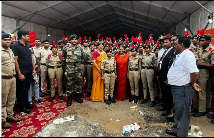
फतेहपुर पूर्व सांसद के साथ जिला कार्यक्रम में