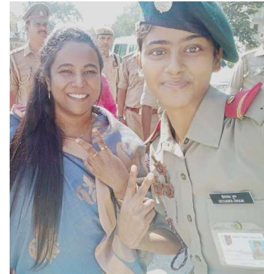
फतेहपुर जिला मैजिस्ट्रेट के साथ