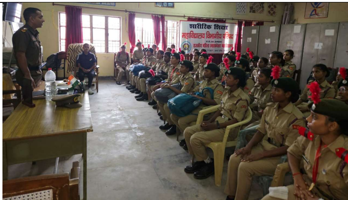
यानों द्वारा कक्ष संचालित