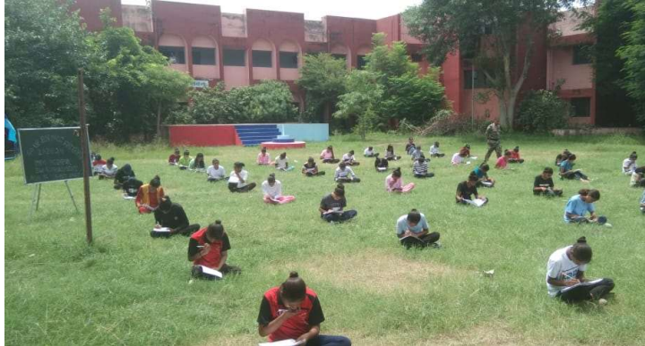
एनसीसी भर्ती परीक्षा 2023