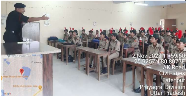
2 Nov 2023 11:59:50 25°92'57"N 80°20'07"E AK Road, Civil Lines, Fatehpur Prayagraj Division Uttar Pradesh