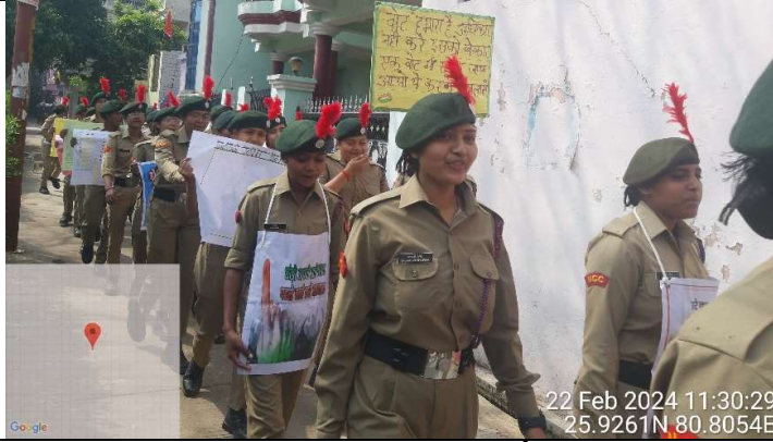
मतदाता जागरूकता कार्यक्रम।