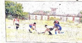
स्पेडर्स स्टेडियम में अभ्यास करते खिलाड़ी।