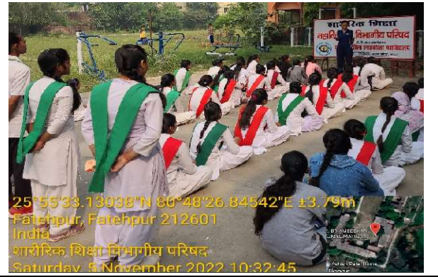
25°55'33.13038"N 80°48'26.84542"E ±3.79m Fatehpur, Fatehpur 212601 India शारीरिक शिक्षा विभागीय परिषद Saturday, 5 November 2022 10:32:45