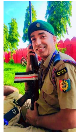
अधिकारी प्रशिक्षण अकादमी कामठी नागपुर