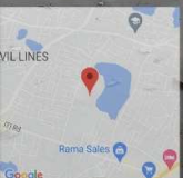
23 Nov 2023 08:15:12 25.9260N 80.8075E AK Road Civil Lines Fatehpur Prayagraj Division Uttar Pradesh